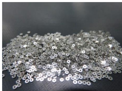
铂铱合金 X 射线不透明标记